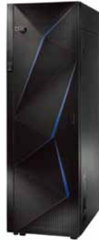
IBM Power 780

완전한 비즈니스 시스템 요구사항을 위한 Power 780은 가장 처리량이 많은 애플리케이션 워크로드에서 탁월한 성능 조합을 제공하며 가용성 기능으로 비즈니스를 중단없이 실행합니다. 또한, PowerVM 가상화는 비용을 절감하고 용량 온 디맨드 기술을 유지하는 효율성을 극대화해 중단 없이 확장하므로 비즈니스 탄력성을 유지할 수 있습니다. 이런 모든 기능을 하나의 통합된 에너지 절약형 패키지에 제공하므로 Power 780은 최고의 비즈니스 솔루션이 됩니다.